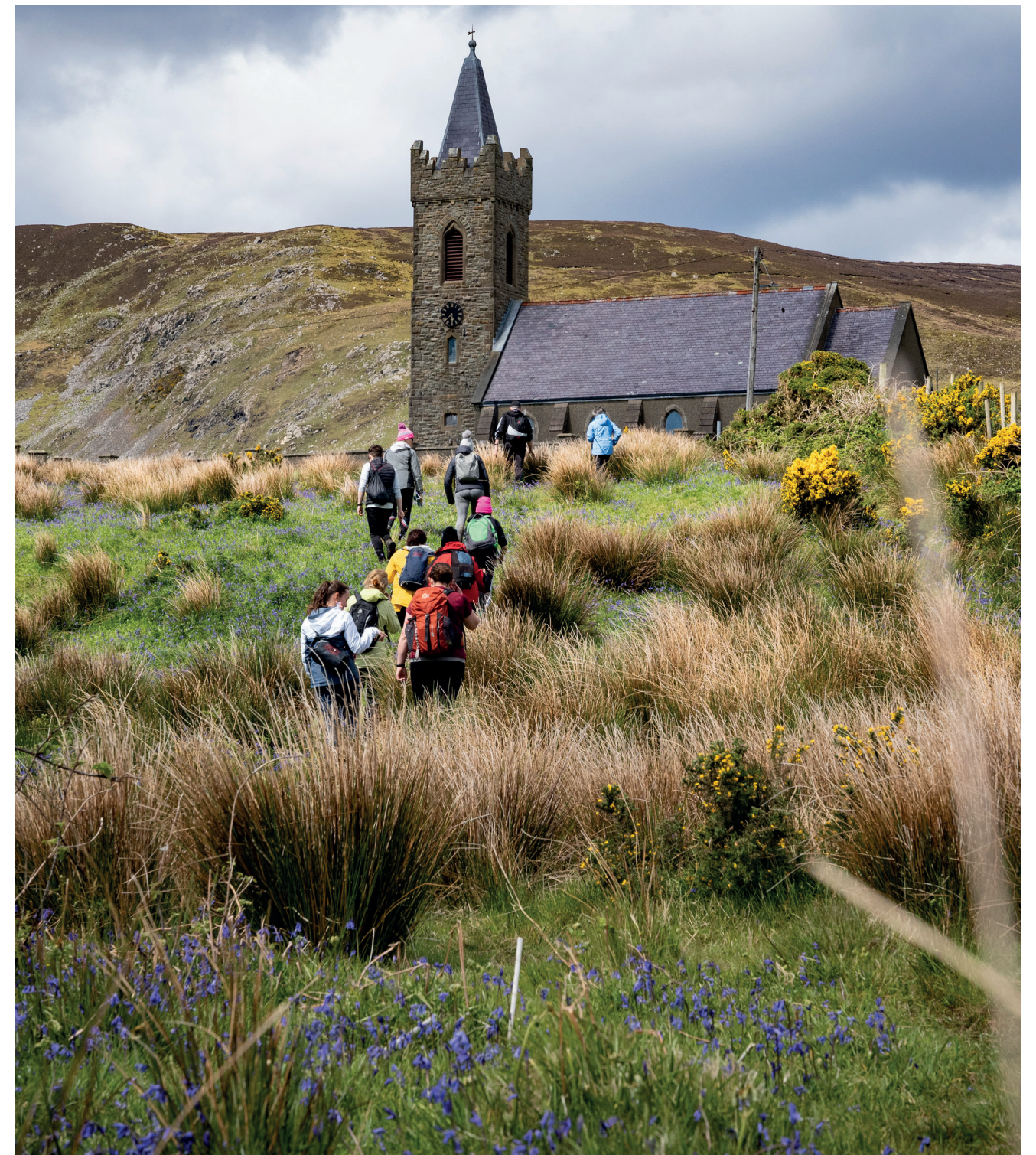
Gleann Cholm Cille: An Áit agus a Naomh — Tionscadal chun digitíú a dhéanamh ar mhionlogainmneacha Ghleann Cholm Cille, Colmóille 1500 An Scéim Deontais

Spraoi agus Spórt 2020 — idir cheardlanna ar líne agus cheardlanna suíomhbhunaithe le haghaidh tionscal na cruthaitheachta agus úsáid á baint as aomhainní an FabLab. Cuid den aiseolas a bhí ann: “an-mhaith agus faisnéiseach”, “chabhraigh sé liom mo mojo cruthaitheach a fháil ar ais”.