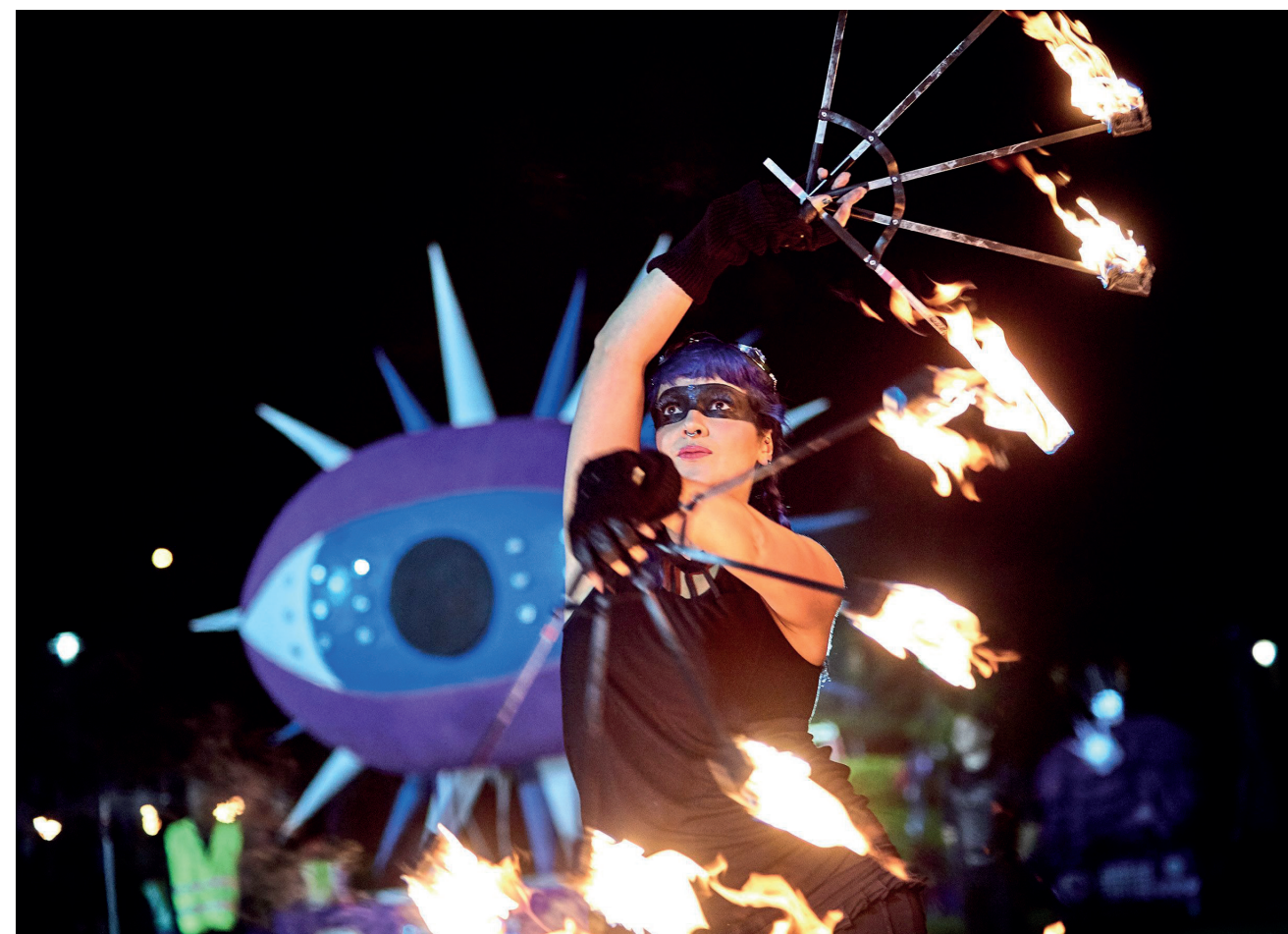
Taibheoir tine in Inis Eoghain Seó Cybertribe Carnival ar, ag Páirc Bhaile Bernard McGlinchey, Leitir Ceanainn, Oíche Chultúir 2019