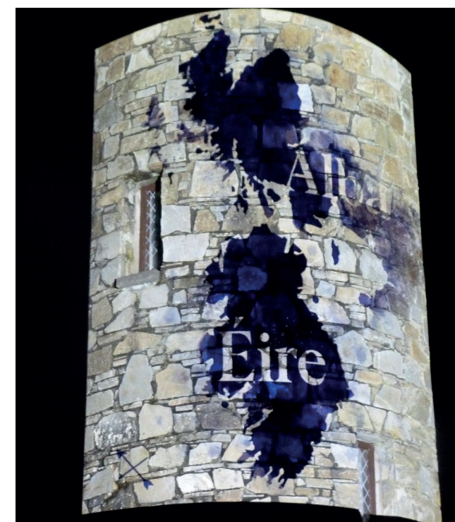
Teilgean ag Oidhreacht Cholmille Ionad mar chuid de shoilsithe 'Coinneal Cholmille' ar fud na hÉireann agus na hAlban chun ceiliúradh a dhéanamh ar lá breithe Cholmille in aois a 1500 dó Grianghraf: Deirdre Harte, Nollaig 2021