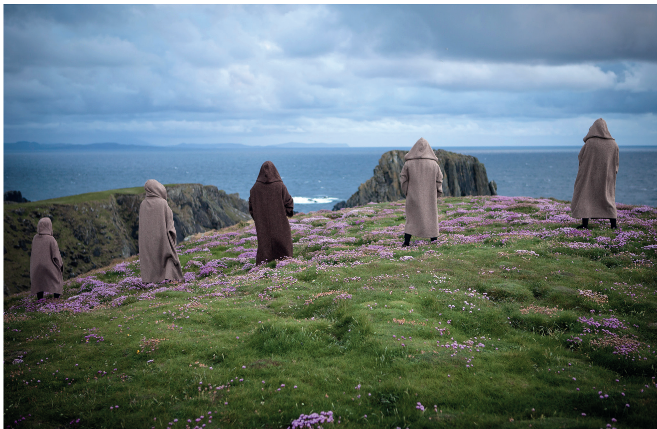
Tionól an Fhórsa, aighneacht Glaonna Oscailte le haghaidh Chruinniú na nÓg in 2020 a thug daoine óga le chéile daoine, Tai Chi, Star Wars, soannán agus mórthaibhseacht an radhairc ar Choróin Bhanba, Cionn Mhálanna